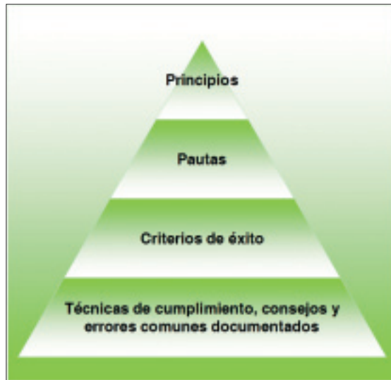
Figura 3. Capas de la WCAG 2.0.

La segunda versión de las WCAG se estructura en una serie de capas (figura 3):